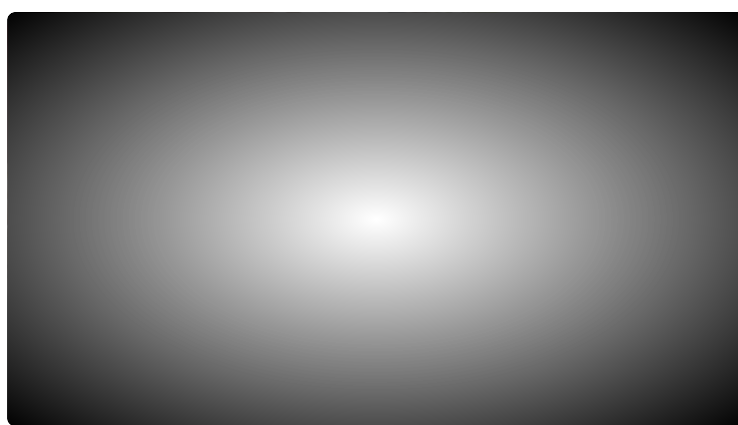
Puzzelen tijdens de lockdown.

23 oktober 2020, 21:00 • 3 minuten leestijd